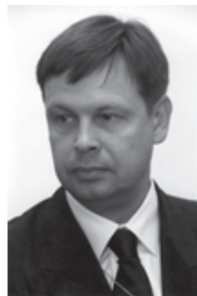
MARGUS HANSON, kaitseminister

Meie arusaam oma territooriumist laieneb. Me ei taga julgeolekut pelgalt konkreetsele ohu korral minnes, vaid ka aidates summutada meie lapsi mõjutavat kuritegevust neis maailma kaootilistes piirkondades, mis võimaldavad näiteks narkootikumide tootmise ja smugeldamise vohamist. Meie arusaam julgeolekust peab tegema hüppe uuele tasemele.