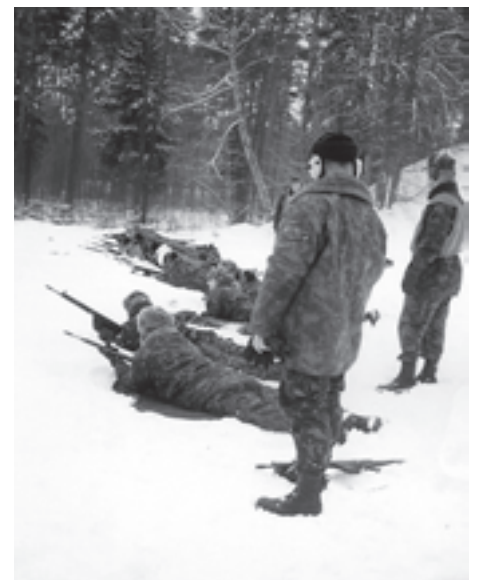
Talvelaagrist osavõtjad laskerajal...

Esimene päev oli saabumispäev. Vastavalt laagri kodukorra aluseks võetud teatmeraamatule "Ohvitser" (autor J. Sepp; Tallinn: J. Pals 1933) nimetas Eesti Reservohvitseride Kogu talvelaagri ajaks, 26.–29. veebruarini 2004 Haanjamehe talu söögi-saali EROK ajutiseks kasiinoks, kus toimus ohvitseride sisemise sideme tugevdamine ühises ringis ohvitseride kasiino reeglite kohaselt iga päev kuni kella 22.30ni.