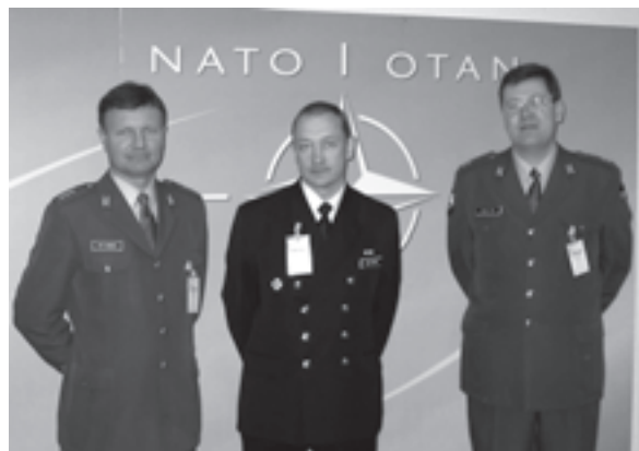
EROK esindus CIORi talvekonverentsil.