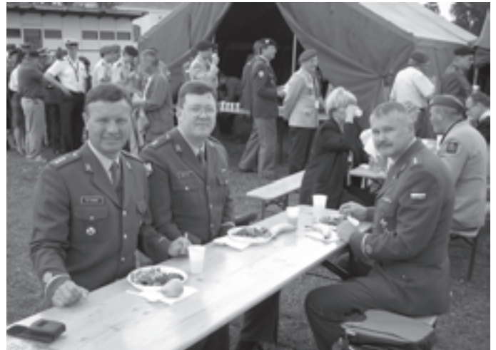
EROK esindus CIORi suvekonverentsil Viinis.

Tuleb tõdeda, et sümposioonist kujunes ettekandjate ja auditooriumi moodustava-