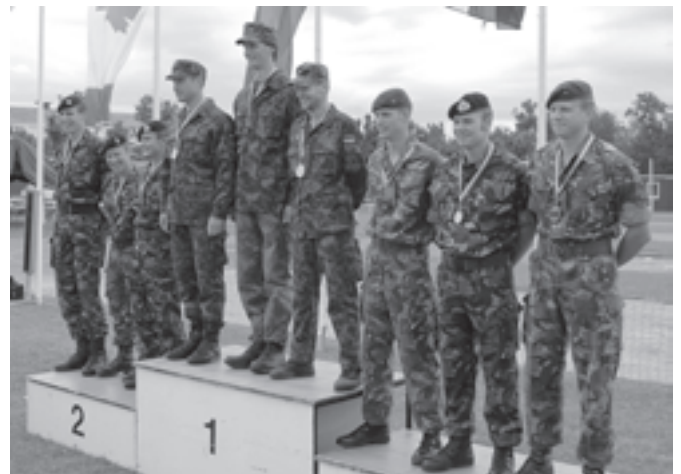
Eesti võistkond autasustamispedestaali kõrgeimal astmel.

Püstolilaskmine toimub analoogselt automaadilaskmisele, kuid distants on 25 m ja täpsuslaskmise ajalimiit on 2 minutit, kiirlaskmisel 35 sekundit.