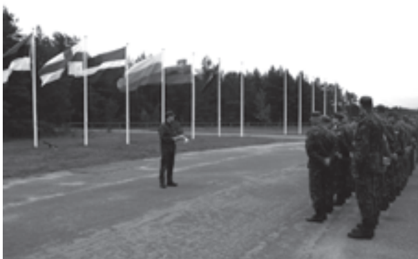
Avatseremoonia Männiku lasketiirus.

Laskevõistlusel oli kavas 9 mm püstoli tiirulaskmine 25 m distantsilt, 9 mm püstoli practical -laskmine, automaadi AK 4 practical -laskmine, automaadi tiirulaskmine distantsilt 100 m lamas, põlvelt ja püsti ning Galil Snaiperi laskmine distantsilt 300 m. Tiirulaskmistel selgitati paremusjärjestus vastavalt 10 lasu (automaadis 3 x 10 lasu) punktisummale, püstoli practical -laskmises punktide ja aja suhtele,