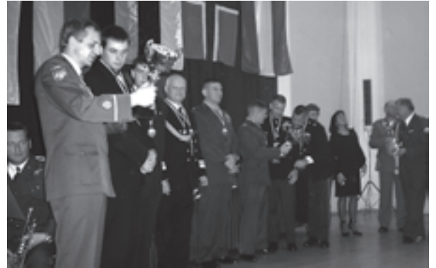
EROK võistkond Poznanis "saaki" uurimas.

Et kasutada olnud laskeväli oli Poolale omaselt hiigelmõõtmega, võisteldi mitmel alal samaaegselt. Võistlus oli põhjalikult kavandatud ja ettevalmistatud, mis võimaldas selle vaatamata suurele võitlejate hulgale viia läbi napi viie tunniga.