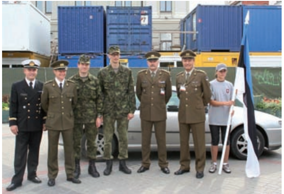
Eesti Reservohvitseride Kogu esindus vahetulet enne CIORi suvekongressi avaparaadi.

Kongress avati paraadiga, kus osalevate riikide ohvitserid marssisid oma riigilippude järel Riia Kongressikeskuse esisele väljakule. Seejärel peeti kõnesid ning paraad lõppes ühisfotoga, kus oli mitusada ohvitseri (pildistati