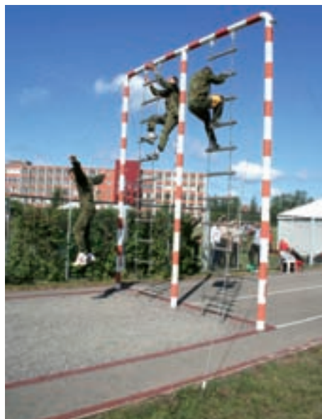
EROK MilComp i võistkond maataktusribal.

maja katuselt). Järgmised päevad olid kella 8st hommikul kuni kella 18ni õhtul sisustatud nõupidamiste ja ettekannete kuulamisega. Õhtuti ootasid vastuvõtud ja muud esindusüritused: kaitseministri vastuvõtt, Riia linnapea vastuvõtt (kogude esimeestele), Lätit tutvustav õhtu Lido vaba aja keskuses, noorte ohvitseride õhtu, mille programmi kuulus kelgutamine Sigulda bobirajal, gala dinner pidulikes õhtuvormides... Kongressipäevil ilmus CIORi suvekongressi eri-